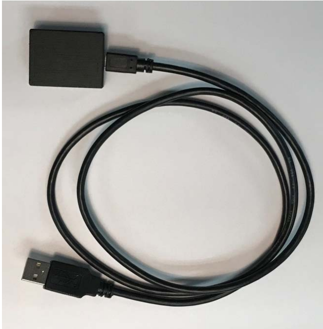
Abb. 4: USB-Kabel und Infrarot (IR)-Empfänger