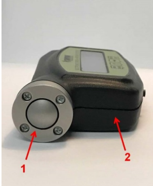
Abb. 7: Prüfspitze (1) Vorderseite (2) und Körper (3)