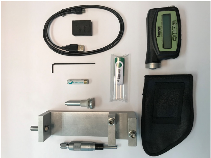
Abb. 2: Modell 42142ADV und 42143ADV