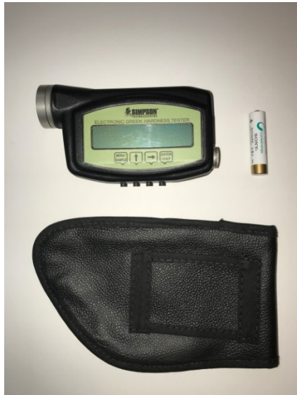
Abb. 1: Modell 42142 und 42143